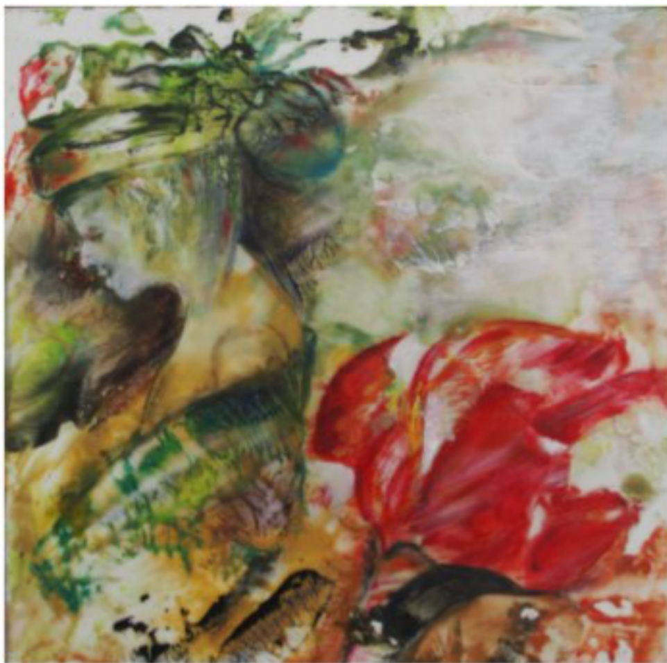
gut behütet - 2020 - Enkaustik und Öl auf Karton - 30x30 cm