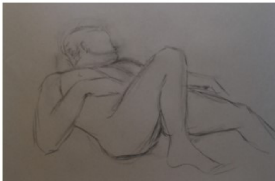
Akt III - 2021 - Kohle auf Papier - 60x40 cm