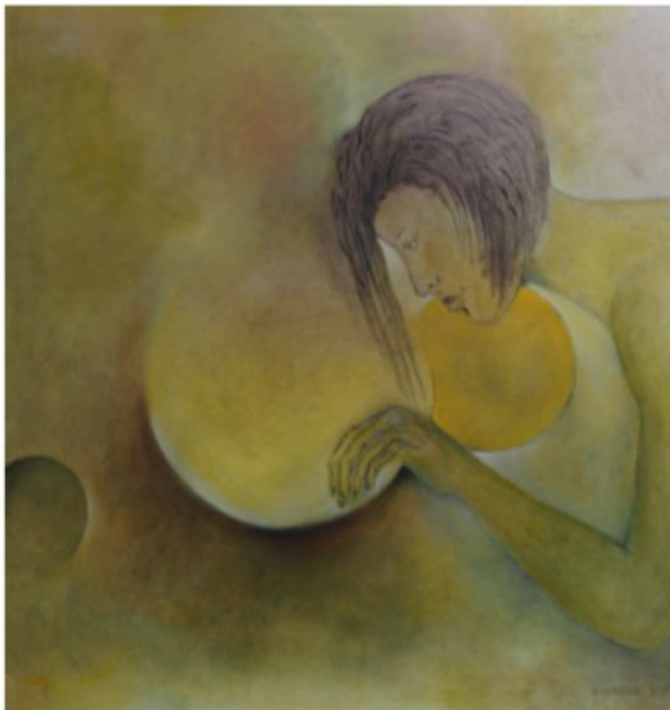
Licht am Ende des Tunnels - 2020 - Öl auf Leinwand - 60x60 cm