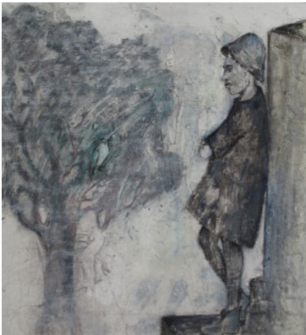
der Mann, der Bäume pflanzte - 2021 - Marmor mehl und Öl auf Leinwand - 50x50 cm