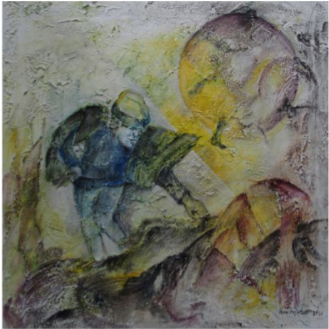
Absturz - 2021 - Öl auf Marmormehl und Leinwand - 50x50 cm