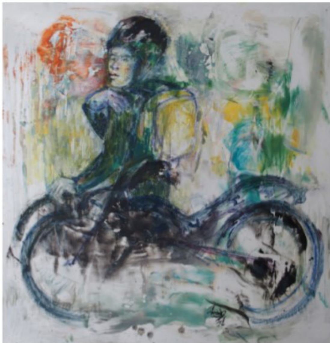
weg hier - 2020 - Enkaustik und Öl auf Leinwand - 60x60 cm