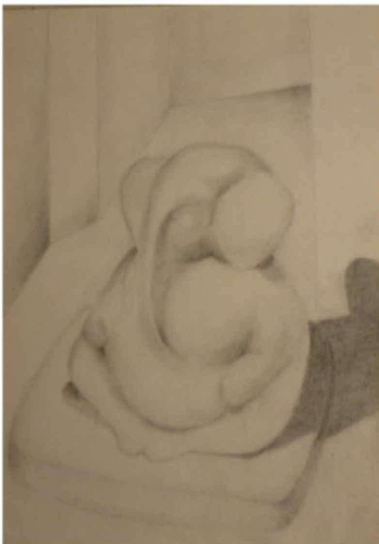
Ganesha - 2014 - Bleistift auf Papier