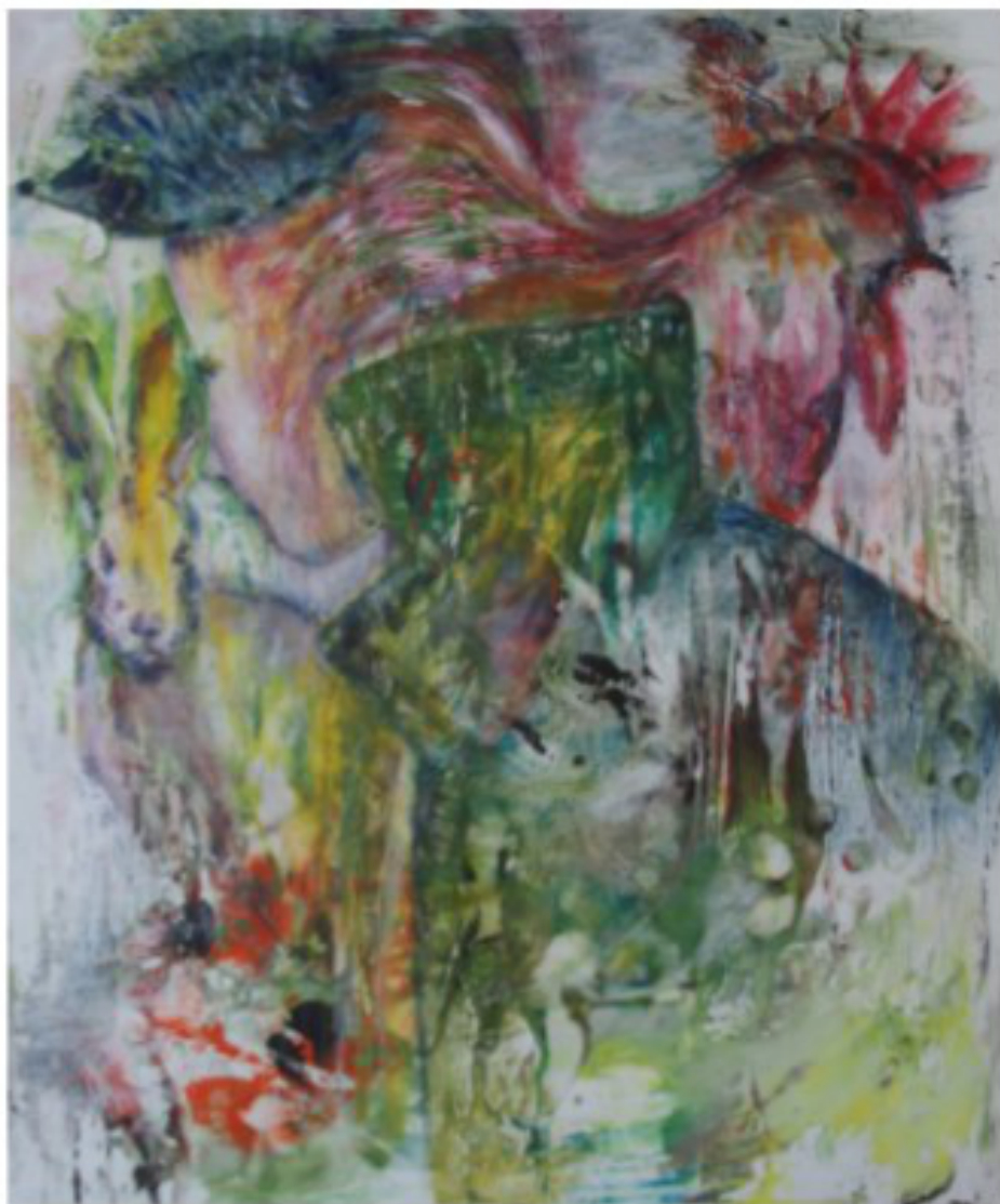
Osterbild - 2020 - Enkaustik und Öl auf Leinwand - 50x50 cm