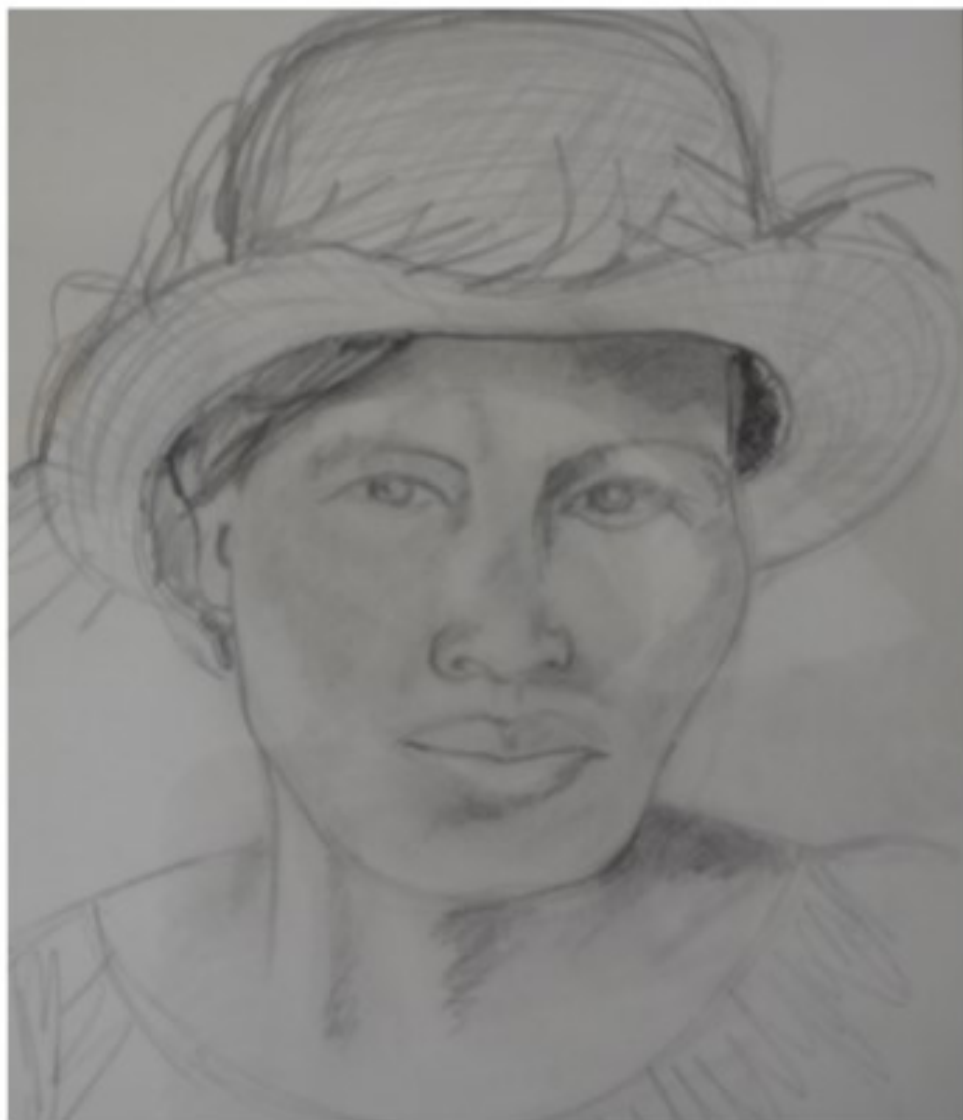
ohne Titel - 1974 - Bleistift auf Papier