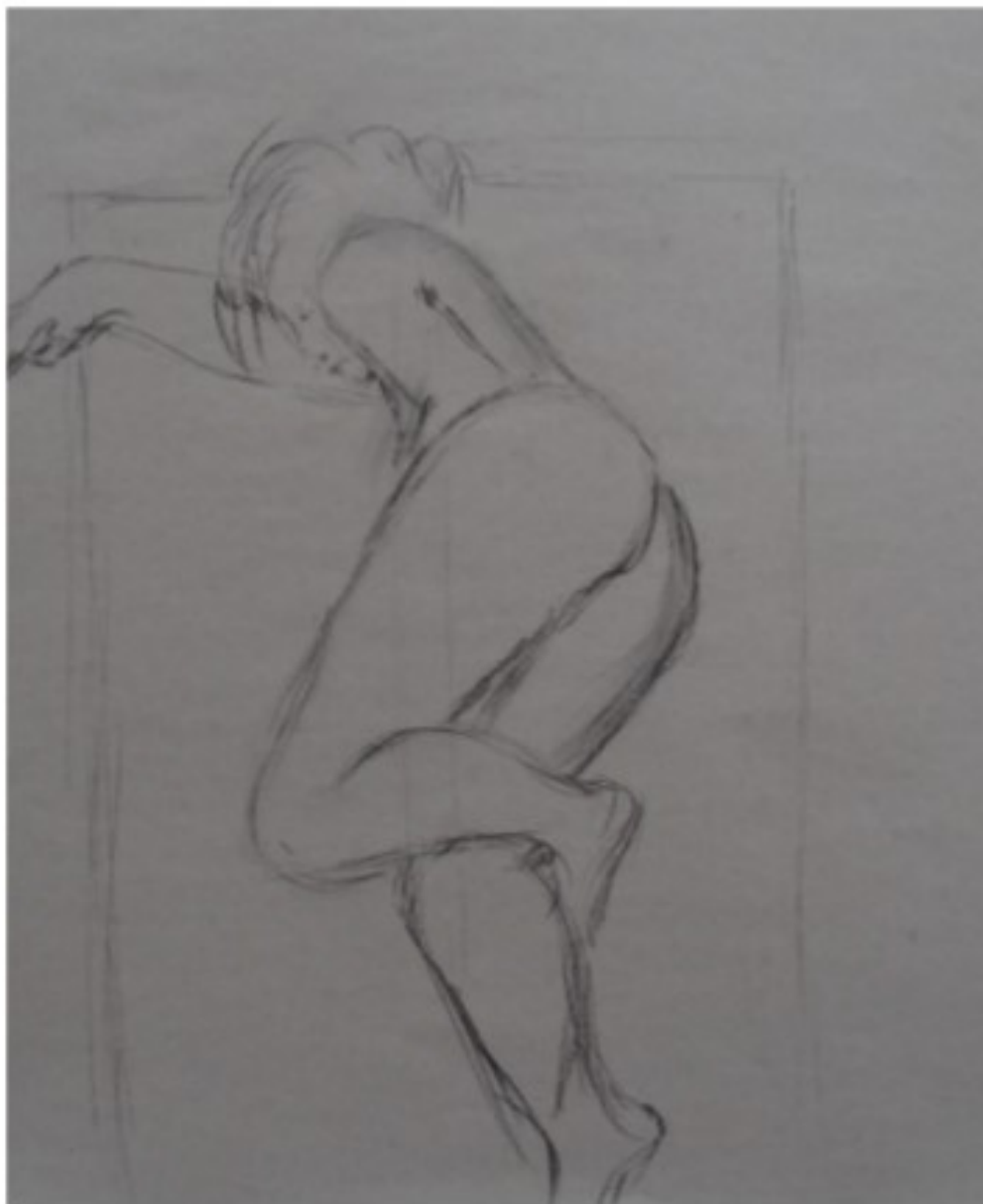
Akt I - 2021 - Kohle auf Papier - 40x60 cm