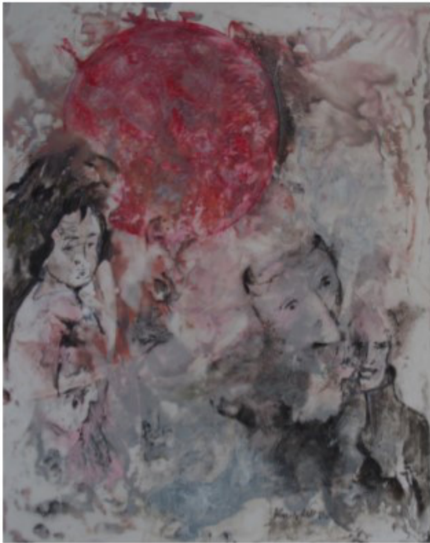
roter Mond - 2020 - Enkaustik und Öl auf Leinwand - 40x50 cm