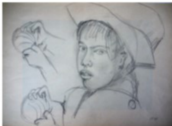
ohne Titel - 1974 - Kohle auf Papier - 40x28 cm