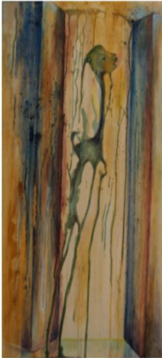
happy liquid - 2019 - Öl auf Holz - 41x90 cm