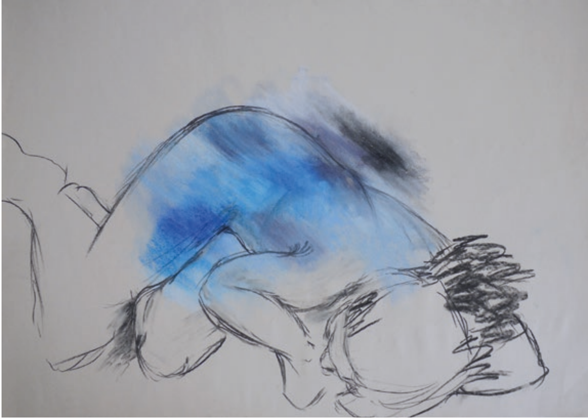
Akt 3 · 2014 · Kohle, Kreide auf Papier · jeweils ca. 50 x 36 cm