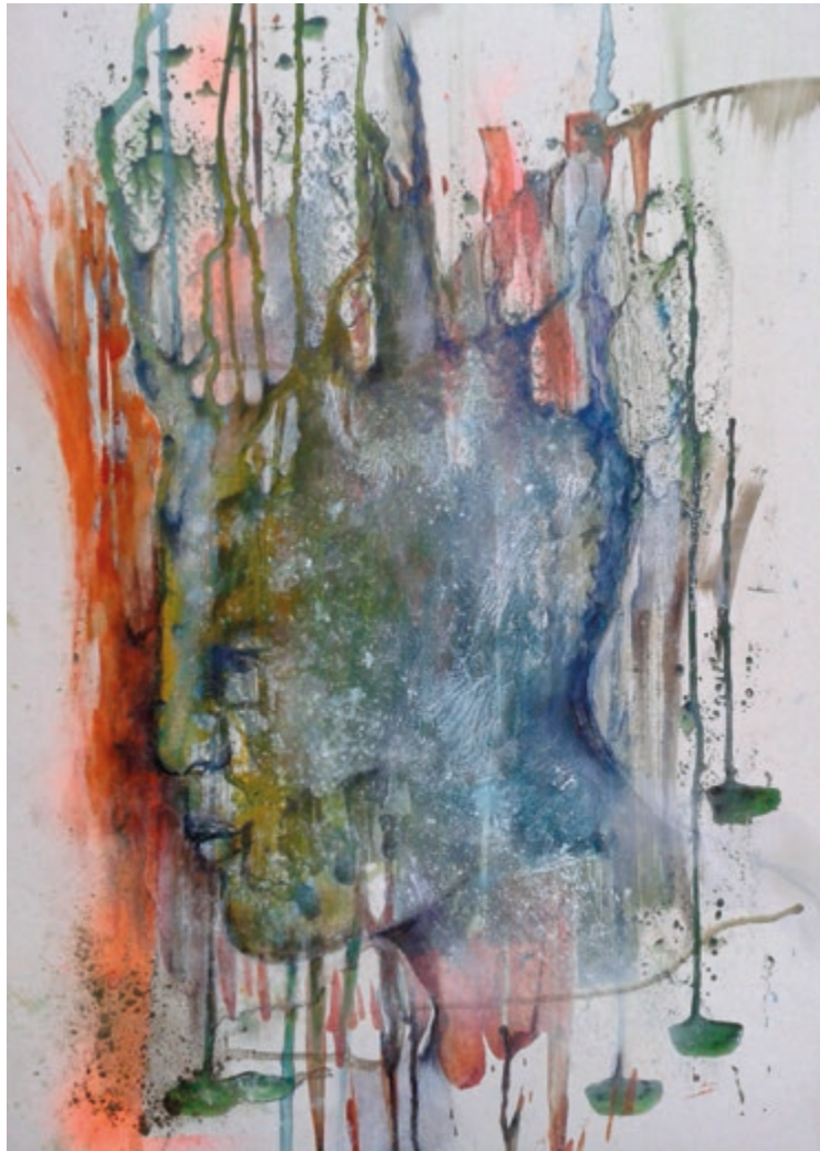
Wildwuchs · 2018 · Mischtechnik auf Karton · 70 x 50 cm