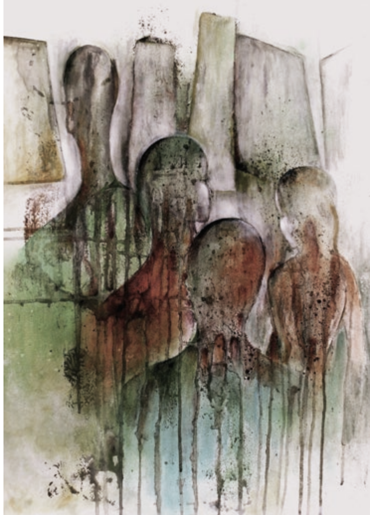
Im Spiegelkabinett · 2019 · Mischtechnik auf Karton · 70 x 50 cm