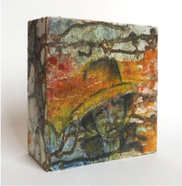
Blickwinkel 1 · 2019