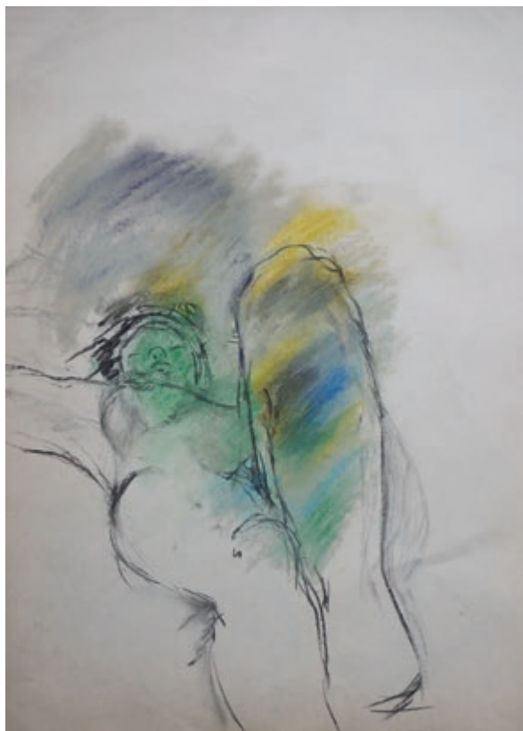
Akt 1 · 2014