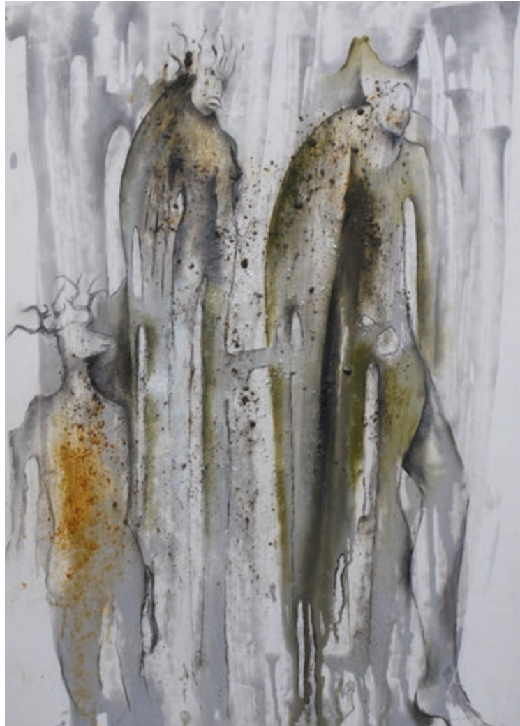
Pause · 2015 · Mischtechnik auf Karton · 70 x 50 cm