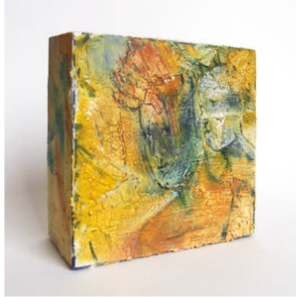
Blickwinkel 2 · 2019