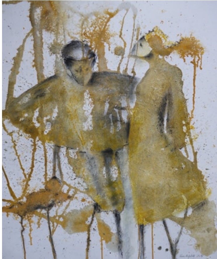
Stelzengänger · 2014 · Mischtechnik auf Karton · 60 x 50 cm