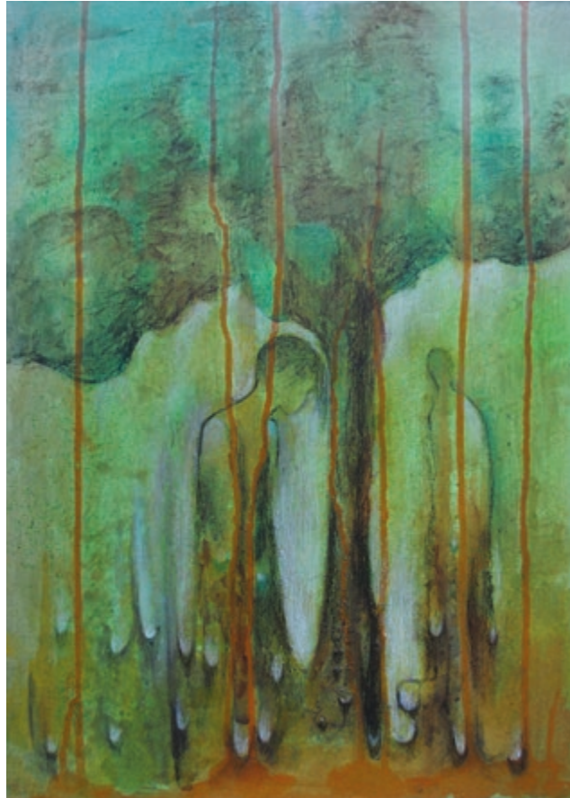
Abschied · 2019 · Mischtechnik auf Leinwand · 45 x 32 cm