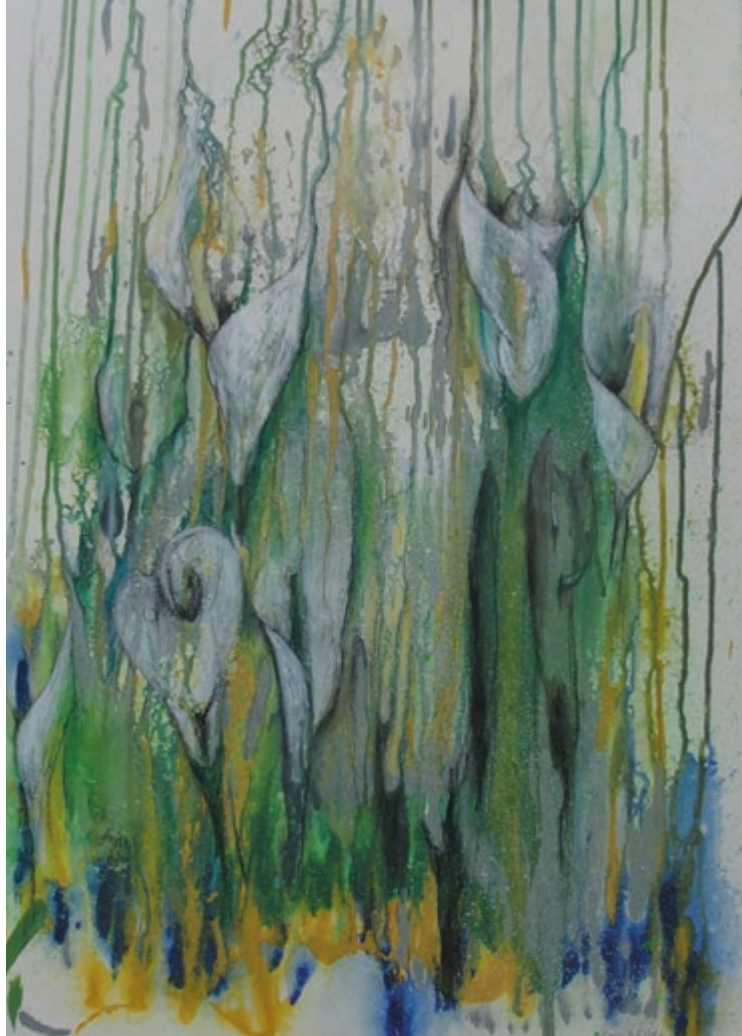
Callas · 2019 · Mischtechnik auf Karton · 70 x 50 cm