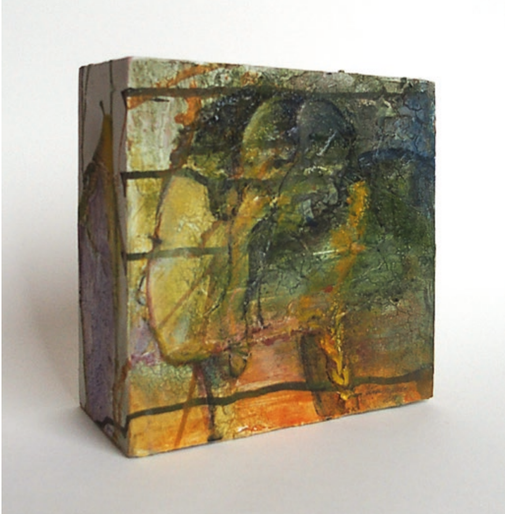
Blickwinkel 3 · 2019 · Mischtechnik auf Holz · jeweils 15 x 15 x 6 cm