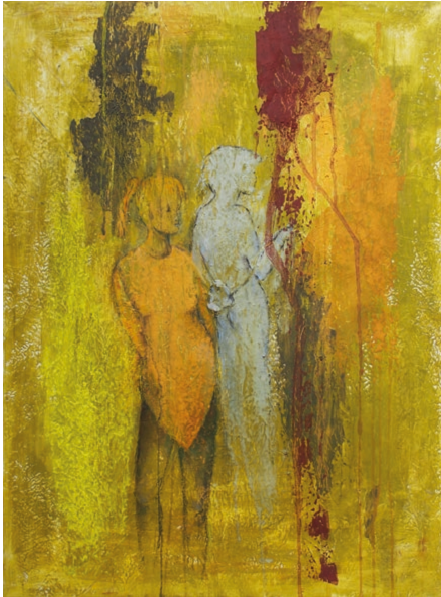
Treffpunkt · 2019 · Mischtechnik auf Leinwand · 80 x 58 cm