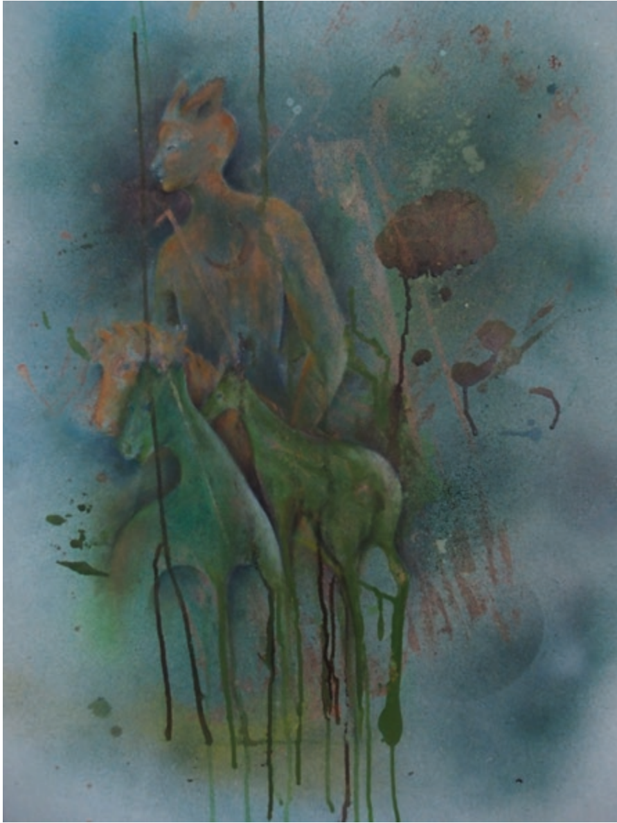
Unterwegs · 2018 · Mischtechnik auf Karton · 80 x 60 cm