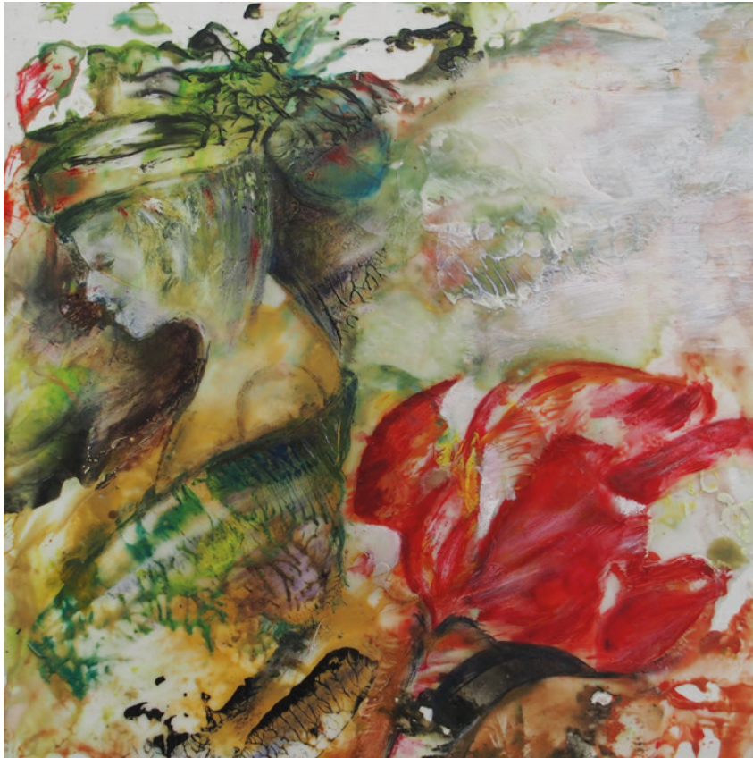
Gut behütet · 2020 · Enkaustik, Ölfarbe auf Leinwand · 40 x 40 cm