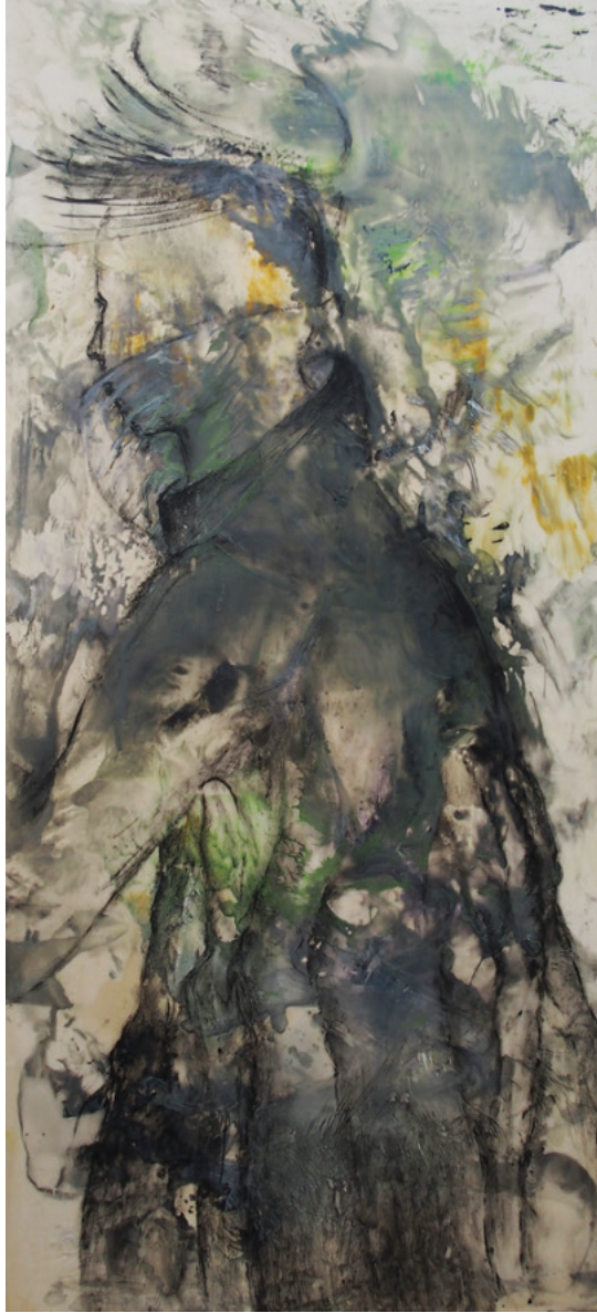
Wax Boy · 2020 · Enkaustik, Ölfarbe auf Holz · 90 x 43 cm