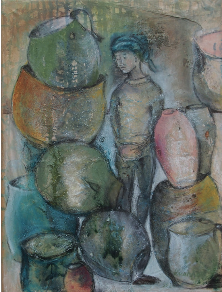
Zu viele Töpfe · 2020 · Mischtechnik auf Leinwand · 40 x 30 cm