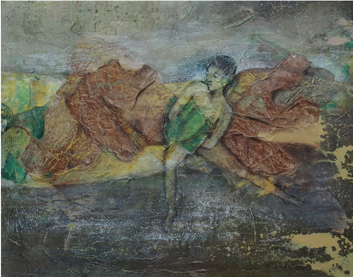
Lass los · 2020 · Mischtechnik auf Leinwand · 40 x 50 cm