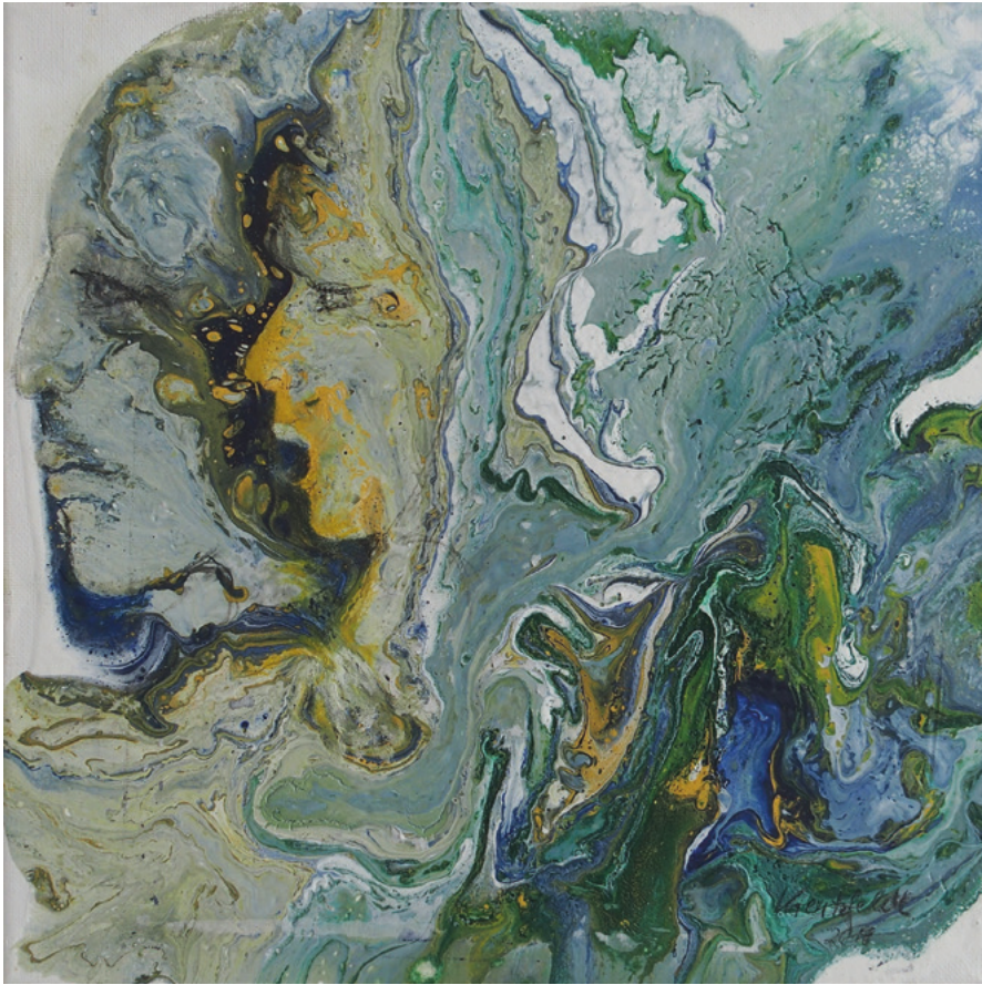
Wir zwei · 2019 · Acrylic Pouring auf Leinwand · 40 x 40 cm