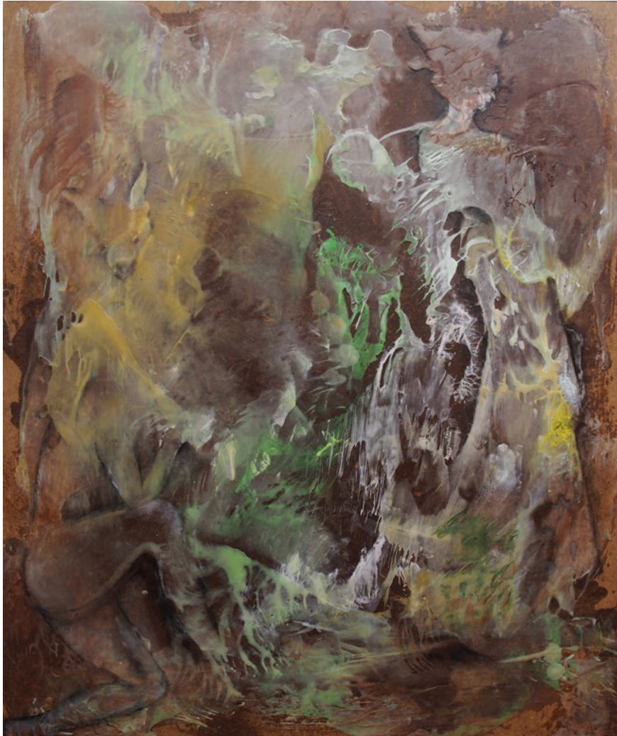
Witches · 2020 · Enkaustik, Ölfarbe auf Karton · 60 x 50 cm