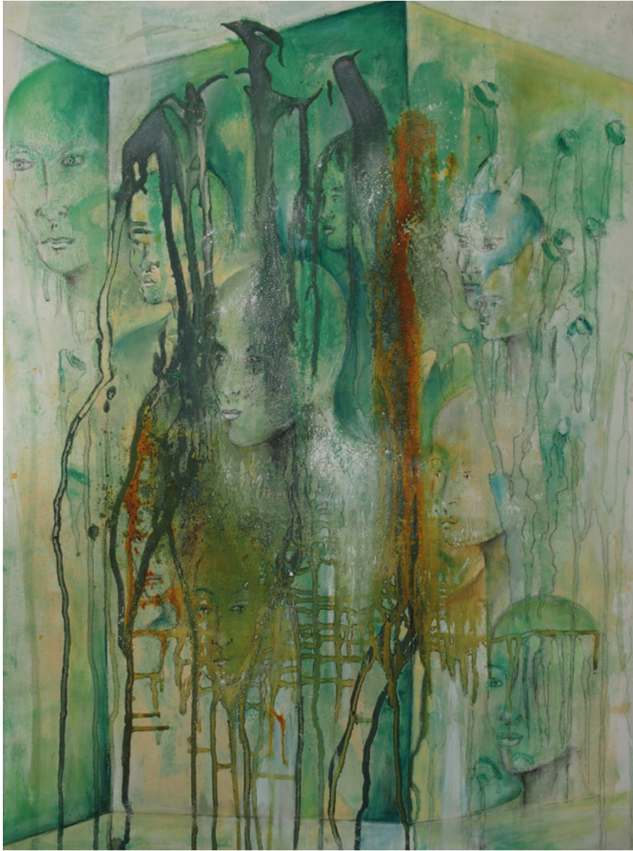
Corona Blues · 2020 · Ölfarbe auf Leinwand · 80 x 60 cm