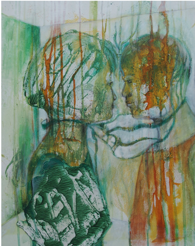
Maske? Keine Frage! · 2020 · Ölfarbe auf Leinwand · 50 x 40 cm