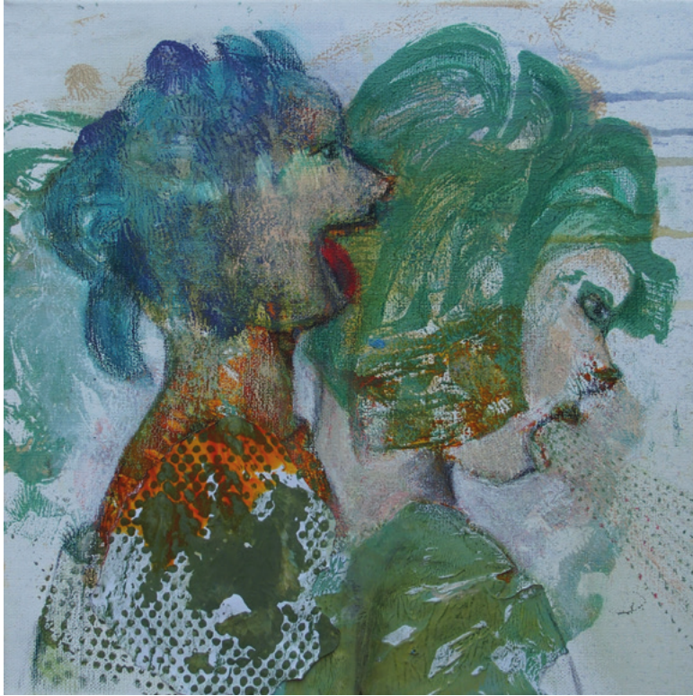
Bäh · 2020 · Dekalkomanie, Ölfarbe auf Leinwand · 30 x 30 cm