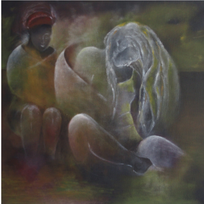
Beieinander · 2018 · Ölfarbe auf Leinwand · 30 x 30 cm