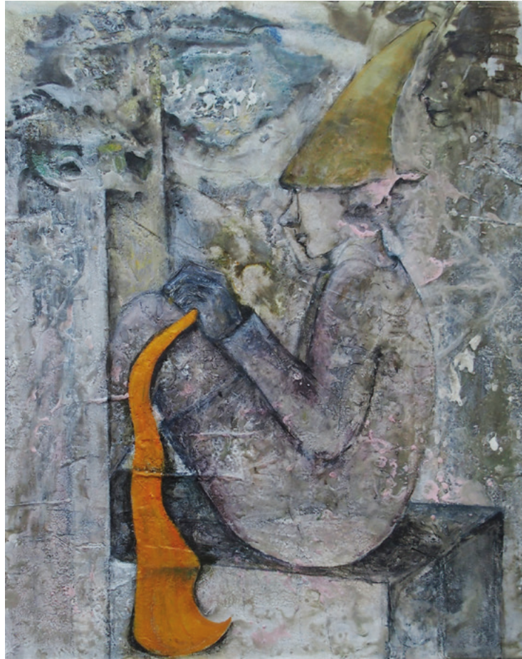
Troll · 2020 · Enkaustik, Ölfarbe auf Leinwand · 50 x 40 cm