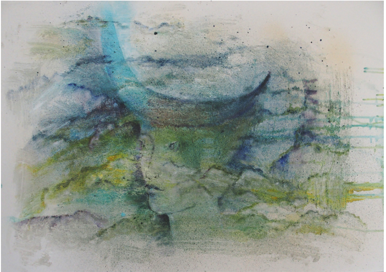
In den Wolken · 2018 · Marmor, Ölfarbe auf Leinwand · 40 x 55 cm